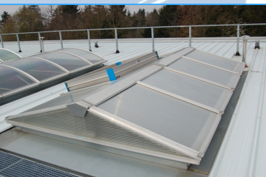
EDIS Centre de formation des pompiers