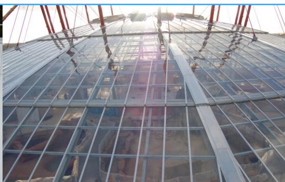
Serre à crocodiles de Civaux (87)